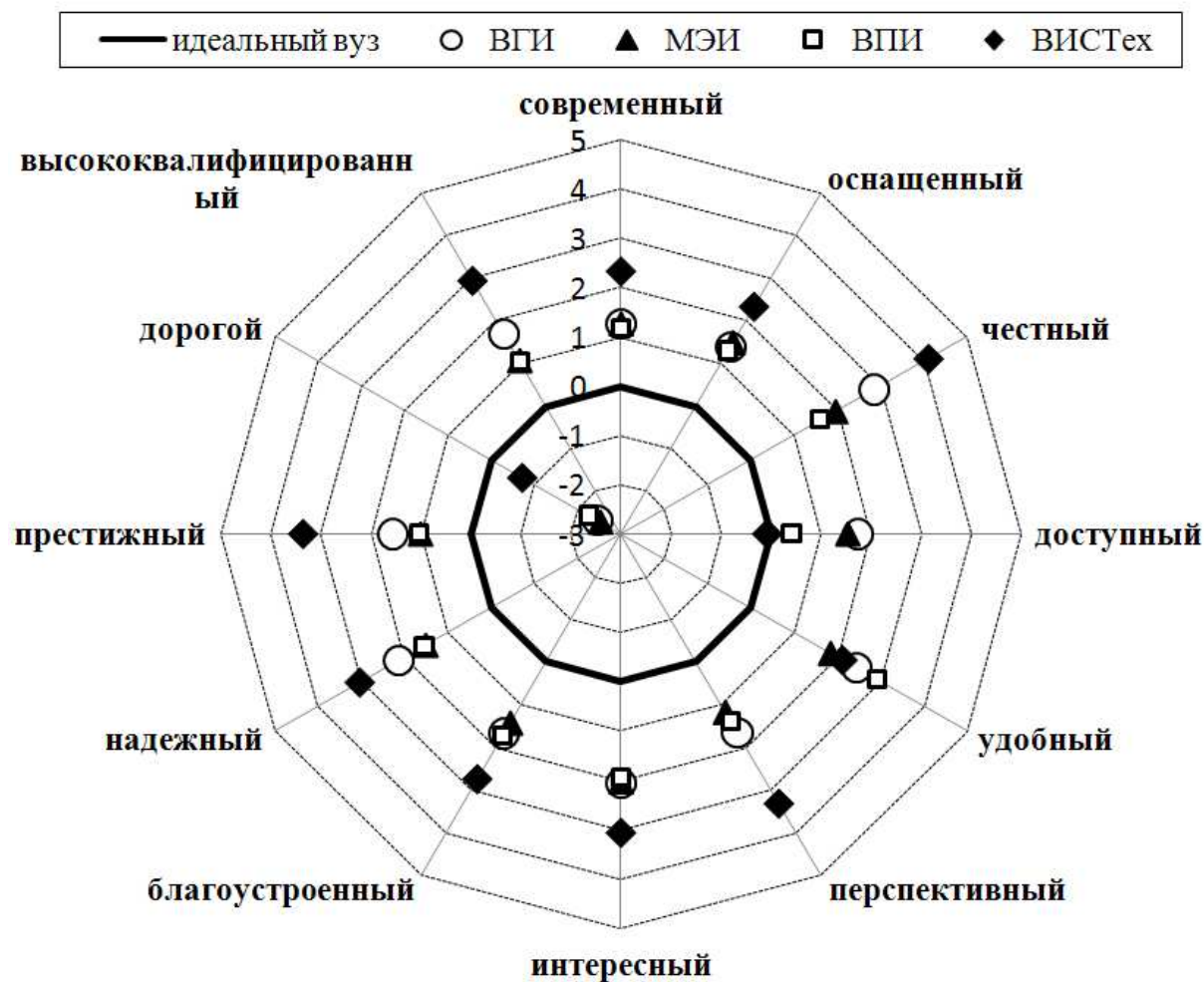
Рис. № 1. Установки студентов в отношении вузов города (средние, means).